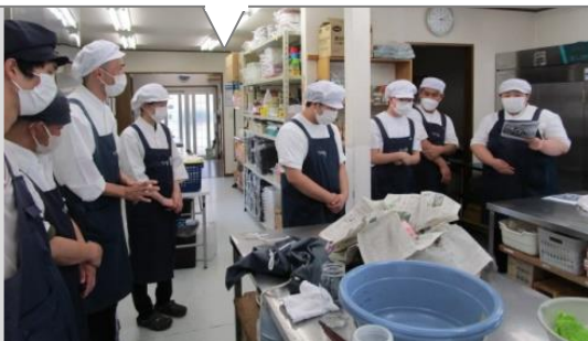
6つある標語の中から 3つを選んでよんでいます