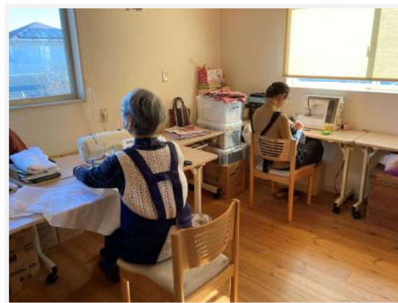
毎週木・金曜日の午前中が活動日。 背中から伝わる、丁寧な手仕事の時間です。

令和7年12月をもって、活動は一旦終了いたします。お二人の温かなサポートが、なかま亭での毎日の活動をより快適で楽しいものにしてくれました。長年にわたるご協力に、心より感謝申し上げます。